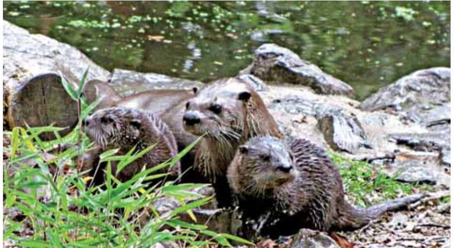
Der Fischotter gehört zur Familie der Marder und wird auch Fluss- oder Landotter genannt.

Was ist eigentlich das Besondere, das Einzigartige an unseren alten Buchenwäldern? Warum sind sie zum Weltnaturerbe ernannt worden? Auf diese Fragen kennt die neue Ausstellung im BuchenHaus die passenden Antworten. Im SchattenWald leiten zehn grundlegende Buchenwald-Botschaften alle Wissbegierigen von einer Neuigkeit zur nächsten. Der Besucher fängt Lichtstrahlen, um die Buche wachsen zu lassen. Er dreht am Rad der Zeit und sieht sich mit der Buche altern. Die Dynamik im Buchenwald kurbelt er an und verfolgt sie im Zeitraffer. Die komplexe Entstehung der Jahreszeiten wird im virtuellen Weltall deutlich. Geheimnisvoll wird es im BoggelReich. Alles in einem Buchenwald ist fünfmal vergrößert. In Höhlen und hinter Rinde entdeckt der Besucher das verborgene Leben, das sich im Rhythmus von Tag und Nacht wandelt.