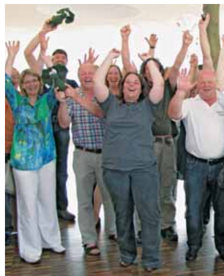
Jubel über die Ernennung zum Weltnaturerbe

erträumten Eintrag in die Weltnaturerbeliste der UNESCO zu feiern. Gleichzeitig war dies eine gute Gelegenheit, all denjenigen zu danken, die den Nationalpark im Nominierungsverfahren unterstützt und bestärkt haben. Allen voran den so genannten Stakeholdern, die bei der Prüfung durch den IUCN-Gutachter David Mihalic in beeindruckender Weise die breite Unterstützung durch die Region demonstrieren. Eine offizielle Feier in der Nationalpark-Region anlässlich dieser einmaligen Anerkennung wird voraussichtlich im Herbst folgen, ebenso wie ein Staatsakt in Berlin.