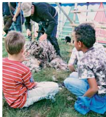
Kinder bei der Schafschur