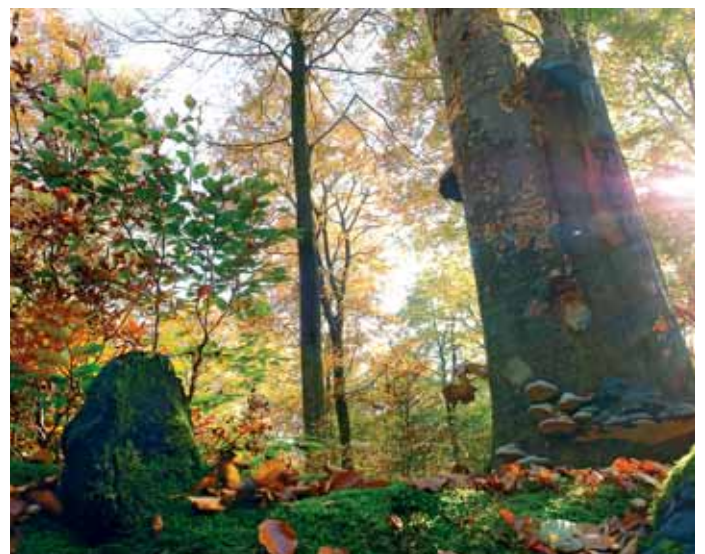
Herbstlicher Buchenwald im Rublauber – Weltnaturerbe