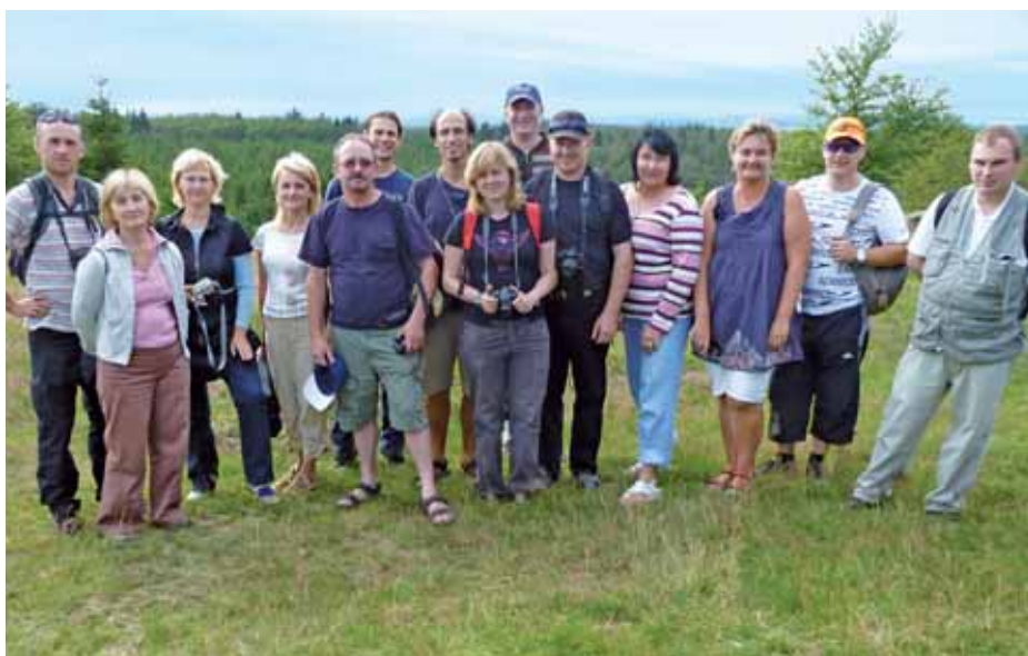
Die litauischen Kollegen auf der Quernst

Vom 27. bis 29. Juli besuchten 14 litauische Kolleginnen und Kollegen aus Nationalparks und Regionalparks den Nationalpark Kellerwald-Edersee. Information und Erfahrungsaustausch standen ganz oben auf dem Programm. Ausgiebig wurde diskutiert, wie deutsche Nationalparke rechtlich verankert sind und wie Nationalparkverordnungen aussehen. Auch das Erstellen von Managementplänen und die touristische Inwertsetzung von Schutzgebieten standen auf der Themenliste. Daher war das Programm für die Gäste auch dicht gedrängt. Der Besuch aller Informationseinrichtungen und zwei Wanderungen boten anschauliche Diskussionsgrundlagen.