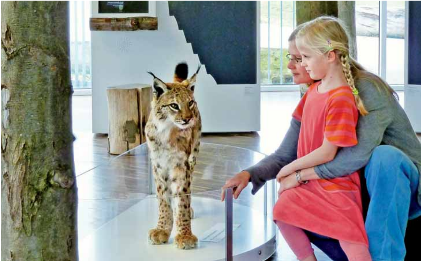
Auge in Auge mit dem Pinselohr

Mit dem neuen Ausstellungsmodul „WildWesen“, das die beiden Tierarten Luchs und Wolf anschaulich vorstellt, greift die Ausstellung im NationalparkZentrum diesmal hoffnungsvoll der Realität etwas vor: Die Wiederausbreitung der ehemals in Deutschland ausgerotteten Tierarten wird sie hoffentlich eines Tages dauerhaft in den Nationalpark Kellerwald-Edersee zurück bringen. Unrealistisch ist dies nicht, zeigen doch die Beobachtungen von einzelnen wandernden Tieren, dass aus stabilen Rudeln die überzähligen Jungtiere dem Rudeldruck ausweichen und weit wandern. In Nordhessen lebte ein einzelner Wolf im Reinhardswald und auch die gesicherten Luchssichtungen zeigen eine Einwande-