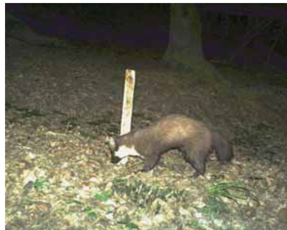
Baumarder am Lockstock – von Fotofalle erfasst