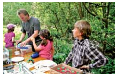
Vielfältiges Programm zum Forschen, Mitmachen, Kreativ werden, z.B. Bachbiologie am Fischhaus Banfe